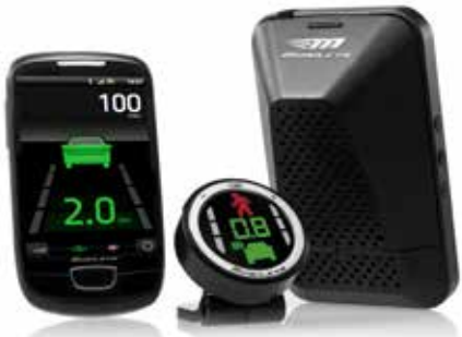
מערכת מובילאיי מערכת חכמה למניעת תאונות דרכים. LP00013591

אתה מוזמן לאבזר את הרכב שלך ולהפוך אותו לייחודי, עם מגוון אביזרים לבחירה: