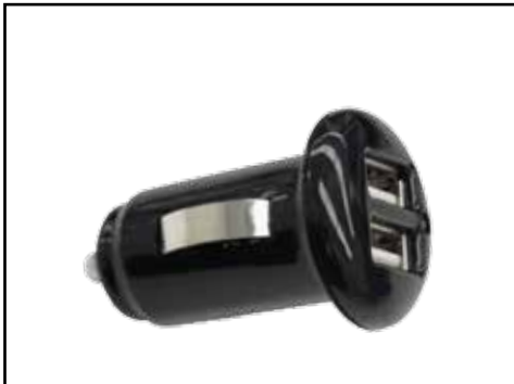
מטען מצת 2.1 אמפר 2 כניסות USB להטענת כל סוגי המכשירים. LP00007192