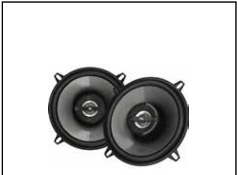
זוג מקולים אחוריים איכותיים LP00007092