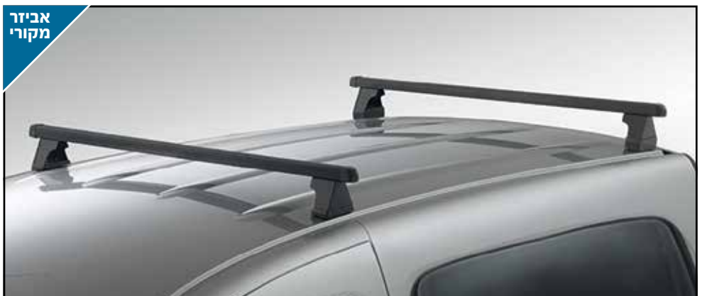
גגון פלדה 2 מוטות רוחביים על גג הרכב, לנשיאת מטען של עד 75 ק"ג. לא מתאים לדגם LONG. LP00008920

האביזרים המופיעים בעמוד זה הינם בתשלום נוסף.