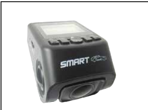
מצלמת תיעוד DVR CB118 מצלמה המתעדדת את דרך הנסיעה. LP0001896