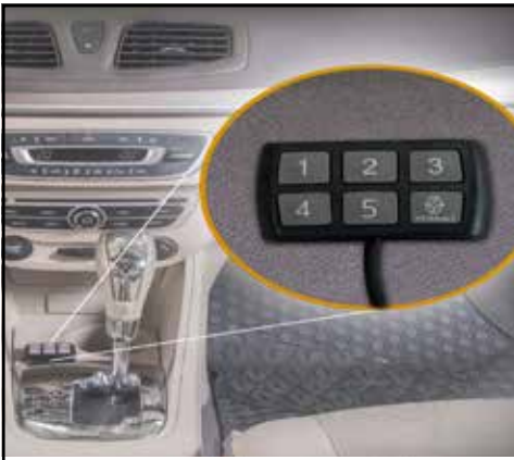
קודן משבת התנעה חכם למניעת גניבות. LP00000045