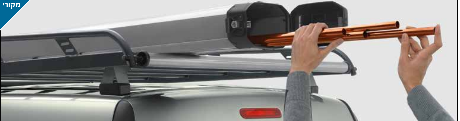
גגון ערסל פלדה אווירודינמי מקורי מעניק שטח אחסון נוסף להובלת ציוד. בעל גלגלת עזר מובנית בחלק העליון להעמסה קלה ונוחה. לא מתאים לדגם LONG. LP00008404