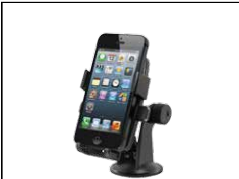
תושבת איכותית לסמארטפון נצמדת לשמשה/לרשבורד, תמיכה במכשירים עד 5 אינץ'. LP00007190

אתה מוזמן לאבזר את הרכב שלך ולהפוך אותו לייחודי, עם מגוון אביזרים לבחירה: