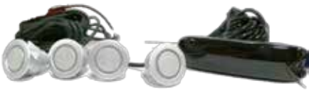
מערכת התראה - חיישן רוורס 4 חיישנים צג רגיל התראה ויזואלית באמצעות צג LCD המורכב מ-3 צבעים ובמרכזו צג דיגיטלי המציג את מרחק/טווח הנסיעה לאחור. LP00000021