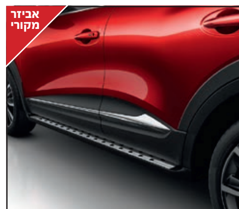
זוג מדרכי סף דלת עם כיתוב Renault מואר LED לבן. LP00013710