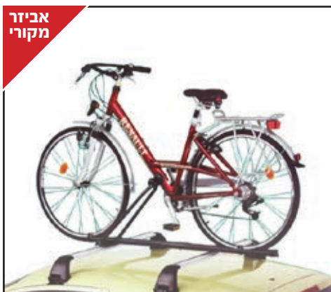
מנשא אופניים MONT BLANC פלדה לאופניים עם קוטר שלדה בין 22 ל-65 מ"מ. LP00007131