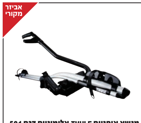
מנשא אופניים THULE אלומיניום דגם 591 לאופניים עם קוטר שלדה בין 22 ל-80 מ"מ. LP00007132

האביזרים המופיעים בעמוד זה הינם בתשלום נוסף.