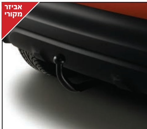
התקן גורר בעל תאימות מלאה לרכב. LP00013762