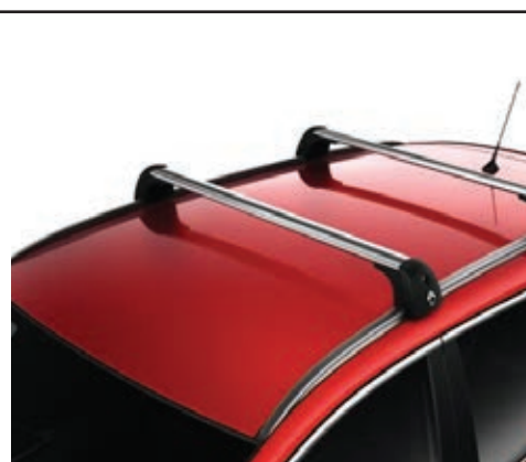
גגון אלומיניום אווירודינמי 2 מוטות רוחביים על גג הרכב, לנשיאת מטען של עד 75 ק"ג. LP00013721 לקשתות אורך / LP00013829 ללא קשתות אורך