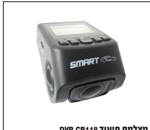
מצלמת תיעוד DVR CB118 מצלמה המתעדת את דרך הנסיעה. LP0001896