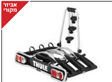
מנשא אופניים לוו גרירה THULE EUROWAY לאופניים עם קוטר שלדה בין 22 ל-80 מ"מ. הטיה של המנשא לגישה קלה לתא מטען. LP00013756 - זוגות 2 / LP00013758 - זוגות 3