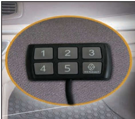
קודן משבת התנעה חכם למניעת גניבות. LP00000045